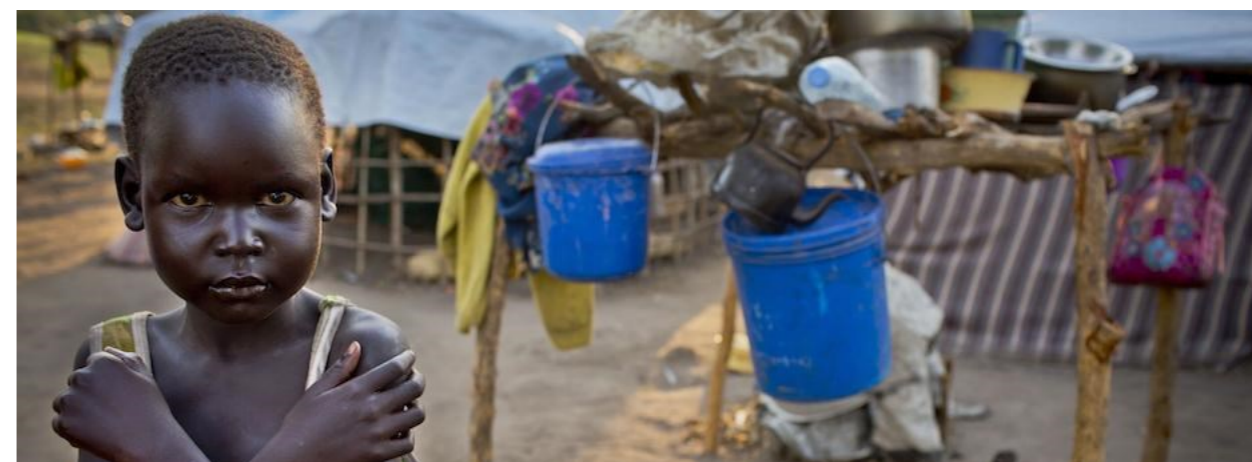
Africké dítě podporované UNICEF.

Vraťme se ale ke správné, či špatné cestě finančních podpor. I v samotné České republice se vyskytuje velké množství různých neziskových organizací, které žádají právě nás, aby mohli zprostředkovat pomoc, kterou bychom chtěli individuálně poskytnout.