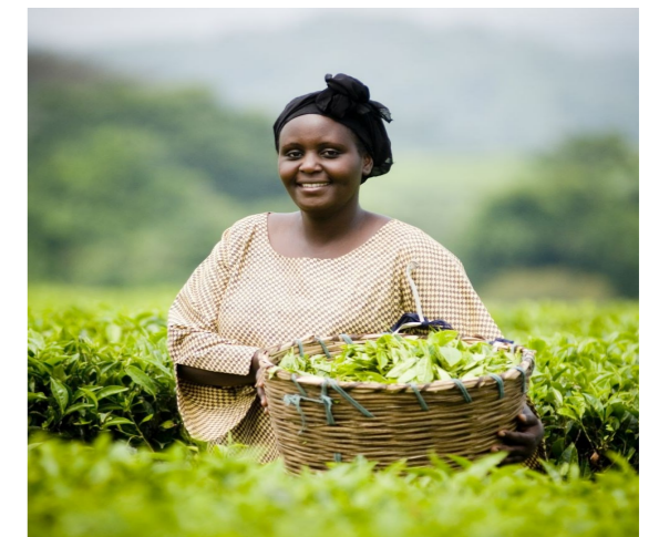
Žena pracující pro společnost podporující „férový trh“

V poslední době bývá slovní spojení „fair trade“ často skloňováno. Někteří z nás už slyšeli o tom, že se jedná o tzv. férový obchod, který zprostředkovává pěstitelům, řemeslníkům nebo farmářům spravedlivou výkupní cenu. Díky té mohou zmiňovaní výrobci žít patřičnějším životem. Jak ale doopravdy poznáme, co je „fér“?