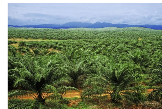
Nekonečné palmové plantáže.