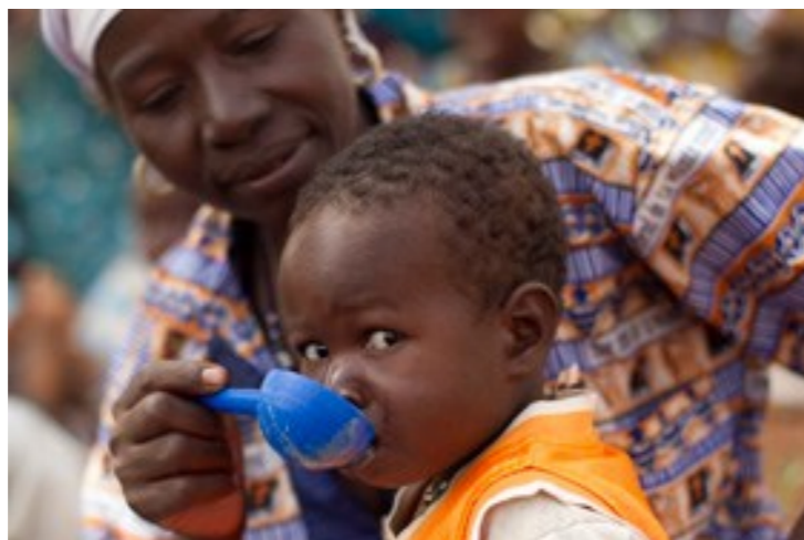
Podpora UNICEF.

Nejjednodušší a nejjistější bude pravděpodobně zvolit pro zprostředkování naší pomoci organizaci s dlouholetou praxí, o které si případně vyhledáme podnětné informace a zkušenosti jiných lidí.